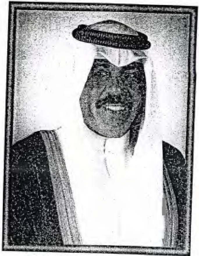
سَيِّدُ الشَّيْخِ جَافَرُ بْنُ إِبْرَاهِيمَ السَّبَّاحِ وَلِيَّ عَهْدِ دَوْلَةِ الْكُوَيْتِ